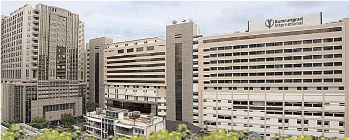
থাইল্যান্ডের বিখ্যাত বামরুনগ্রাদ হাসপাতাল ২

বিশ্বের যে সকল দেশ এই ধরনের পর্যটকদের আকৃষ্ট করতে সমর্থ হয়েছে, তাদের মধ্যে থাইল্যান্ড অন্যতম। ২০০৯ সালে এই দেশটি প্রায় ১৫ লক্ষ বিদেশী পর্যটককে আকৃষ্ট করতে সমর্থ হয়েছিল শুধুমাত্র তাদের উন্নত স্বাস্থ্য ব্যবস্থার কারণে। ২০০৪ সালে এই সংখ্যাটি ছিল ৬৩০,০০০। ২০১৪ সালে শুধুমাত্র বিদেশী স্বাস্থ্য সচেতন পর্যটকদের কাছ থেকে থাইল্যান্ডের হেলথ ট্যুরিজম থেকে মোট আয়ের লক্ষ্য প্রায় ১২.২ বিলিয়ন ইউএস ডলার।